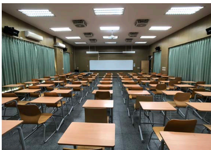
N101 & N102