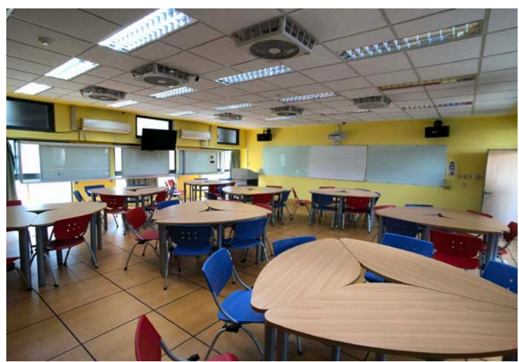
N201 & N203